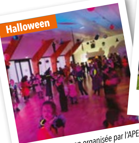
Boom d'Halloween organisée par l'APEL le 21 octobre