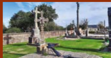
Illustration de végétalisation

La mairie va prolonger cette initiative par la signature de la Charte Départementale, qui engage à d'offrir des obsèques dignes et une sépulture décente aux personnes décédées dans une grande précarité.