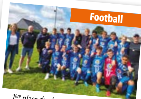
1 ère place du championnat D2 pour les U14 du Football Club Canton du Sel !