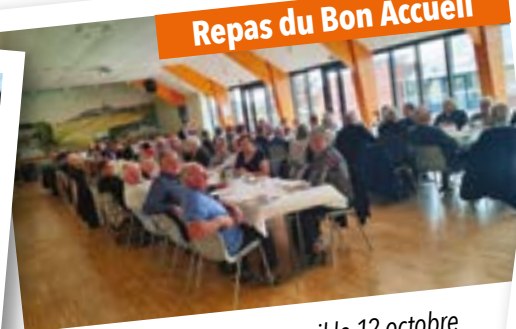
Repas du Bon Accueil le 12 octobre Le plaisir de se retrouver