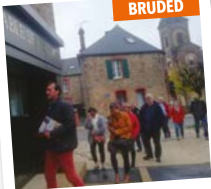
Visite de la boucherie avec le réseau BRUDED - un projet exemplaire