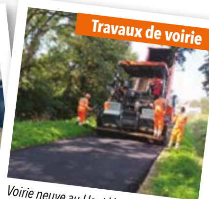
Voirie neuve au Haut-Verrion, la Lande de Pussac, la Mondrais et la Ville-Jean