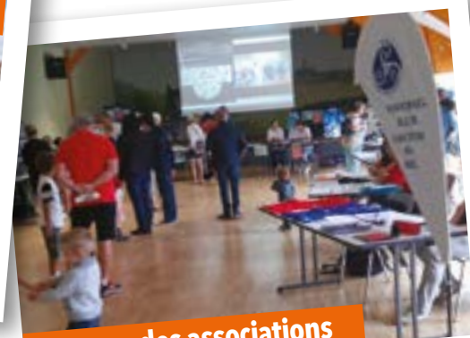
Plus de 160 visiteurs pour la 3 e édition