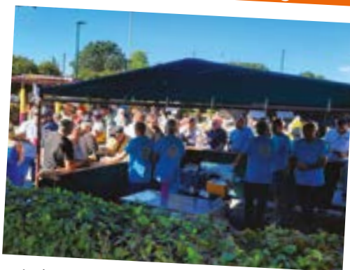
Vide grenier du 11 septembre, foule et soleil