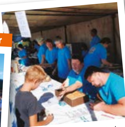
Comité des fêtes - Une belle équipe